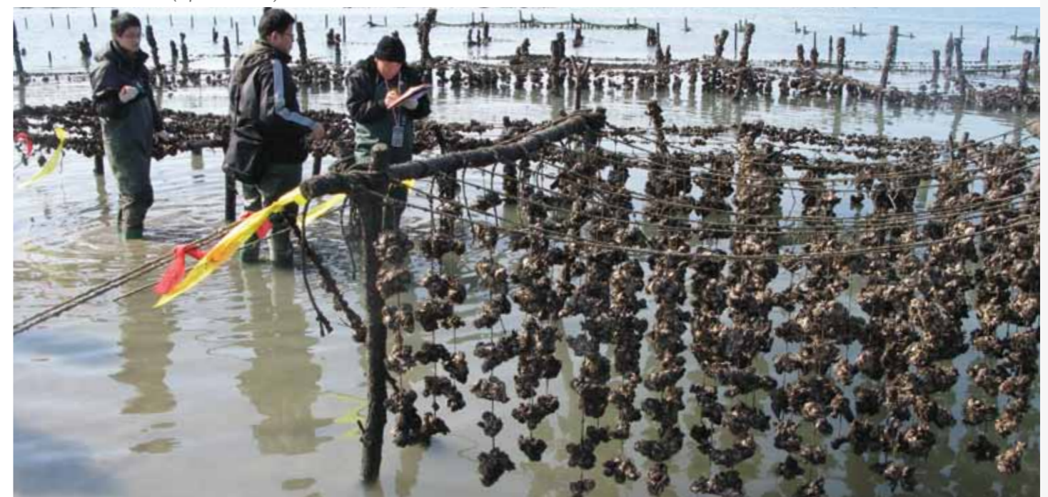
Expertos locales contratados por el Fondo de 1992 examinando los daños debidos a contaminación causados a criaderos ostrícolas tras el siniestro del Hebei Spirit (República de Corea).