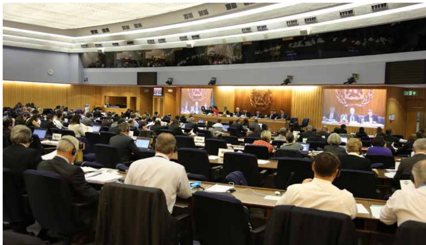
La sesión de octubre de 2013 del Consejo Administrativo del Fondo de 1992, cuando se aprobó la Guía para los Estados Miembros.

Se anima a los Estados Miembros a que transmitan sus comentarios sobre la utilización de las medidas al Director de los FIDAC a fin de incorporar la experiencia y las mejores prácticas y difundirlas a los demás Estados Miembros. Además, se insta a los Estados Miembros a que informen de toda medida nueva, modificada o alternativa empleada en los siniestros, no solo en aquellos que afectan a los FIDAC, sino también los otros.